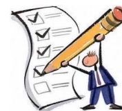
LLENADO DE FORMULARIO