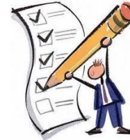
LLENADO DE FORMULARIO